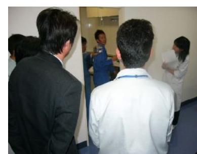
カメラにて排水管の中の作業前、作業後確認