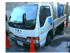
高圧洗浄車の安全対策