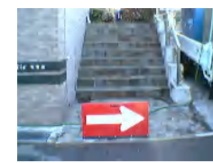
共用部におけるホースの安全対策