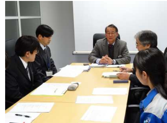
▲F C 技術部会創設の挨拶をする登壇顧問