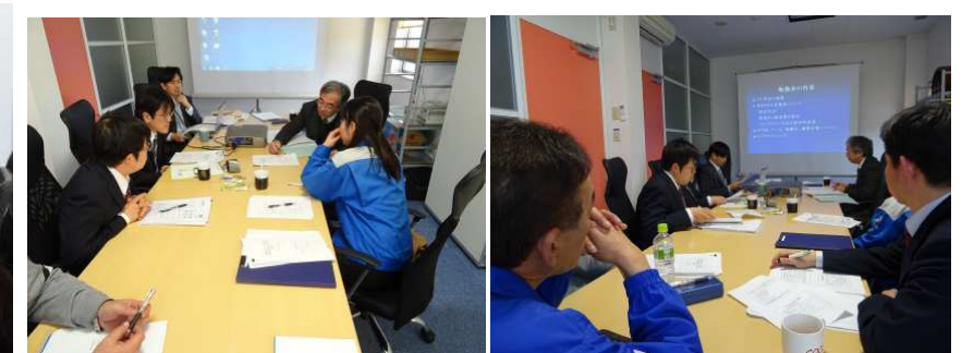
▲意見交換・アドバイスからプロジェクターによる発表の様子

平成27年1月16, 17日の2日間に渡り、弊社のフランチャイズ加盟店による、第1回HER・FC技術部会が開催されました。業務の都合により、残念ながら参加できなかった、宮城、山口ERを除き、本部HERから3名、徳島、三重、京都、琉球から各1名の環境計量士が参加し、日頃の分析での疑問点や工夫や、営業部の人間も混じり、本部への要望など多くの意見交換が行われました。また、本部以外では初めてとなる、三重ERへの県の立ち入り検査の内容報告が行われ、運営2年以上となるFC店も増えてきたことから、日頃の記録書類管理等、立ち入り検査における準備についても話し合われました。なお、初日の勉強会の後には、SICHER塾でお馴染みの、鳥幸で懇親会も実施されました。