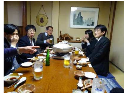
▲鳥幸での懇親会の一コマ

平成27年1月16, 17日の2日間に渡り、弊社のフランチャイズ加盟店による、第1回HER・FC技術部会が開催されました。業務の都合により、残念ながら参加できなかった、宮城、山口ERを除き、本部HERから3名、徳島、三重、京都、琉球から各1名の環境計量士が参加し、日頃の分析での疑問点や工夫や、営業部の人間も混じり、本部への要望など多くの意見交換が行われました。また、本部以外では初めてとなる、三重ERへの県の立ち入り検査の内容報告が行われ、運営2年以上となるFC店も増えてきたことから、日頃の記録書類管理等、立ち入り検査における準備についても話し合われました。なお、初日の勉強会の後には、SICHER塾でお馴染みの、鳥幸で懇親会も実施されました。